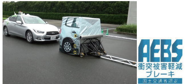
図2 衝突被害軽減ブレーキ性能評価試験の様子

「自動車の先進安全技術の性能の評価等に関する規程」(国土交通省告示)に沿った試験について、公平な認定評価が行えるよう、審査に関する機構規程類を整備し、適切に試験を実施した。また、これにより、将来の認証試験に向けた知識及び技能の習得にも繋がることとなった。なお、2018年度の実績は申請自動車メーカー数：8社 評価型式数：152型式であった。