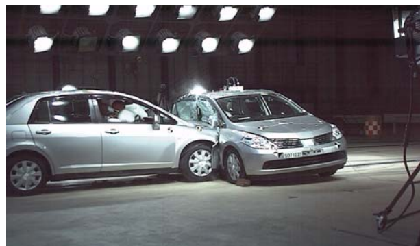
図1 車対車の側面衝突実験の状況