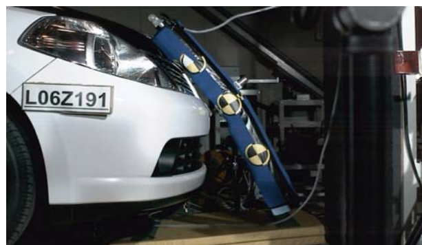
図2 歩行者脚部インパクト衝撃試験の状況