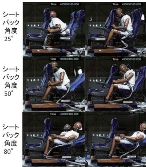
2点式シートベルト 3点式シートベルト