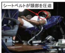
図5 シートバック角度80°、3点式シートベルト条件のダミーの状態 (110 ms)

図5 にシートバック角度80° の3点式シートベルト条件の場合の衝突開始後110 ms時の状況を示す。シートベルトが頸部を圧迫していた。