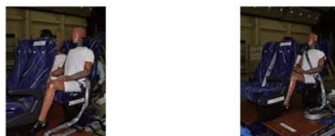
(a) 2点式シートベルト (b) 3点式シートベルト